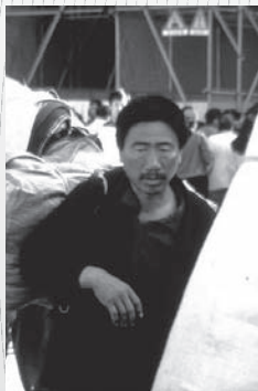
Migrants. Pékin, Chine.

D'autres gouvernements, comme le Canada et le Salvador, avaient des restrictions spécifiques liées au VIH et ont décidé de s'en débarrasser. Au Canada, les organisateurs de la Conférence internationale sur le sida à Toronto en 2006 se sont rendu compte que les personnes séropositives participantes devraient s'identifier sur le formulaire de demande de visa. Les organisateurs et leurs partenaires canadiens travaillèrent rapidement pour démontrer aux ministères gouvernementaux compétents que