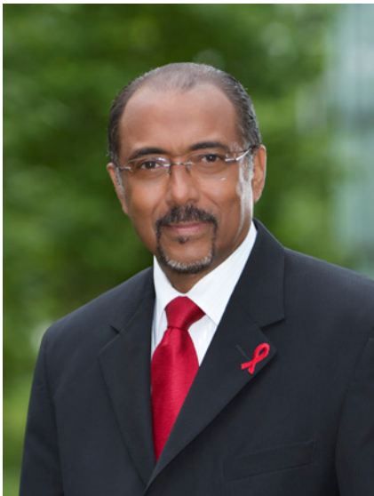
МИШЕЛЬ СИДИБЕ ИСПОЛНИТЕЛЬНЫЙ ДИРЕКТОР ЮНЭЙДС