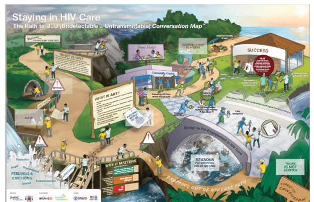
Mapa de conversación, una herramienta educativa diseñada para formar a los miembros de la comunidad