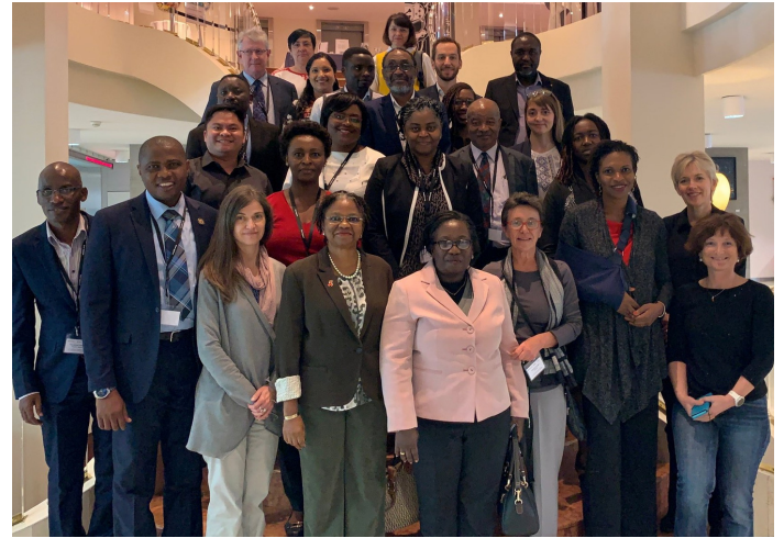
Reunión introductoria de cinco ciudades de Acción acelerada incluidas en el Proyecto. Marzo de 2019, Ginebra, Suiza

Entre los socios encontramos gobiernos locales y nacionales, autoridades sanitarias, organizaciones de la sociedad civil, redes de personas que viven con el VIH y grupos de población clave, el sector privado, organizaciones de carácter religioso, el sector educativo y académico, el gobierno de los Estados Unidos (PEPFAR, USAID, CDC), el Fondo Mundial, clínicas y servicios de atención sanitaria y otros encargados de poner en práctica este tipo de iniciativas.